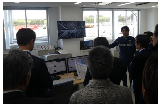
コンテナオペレーションシステムを見学