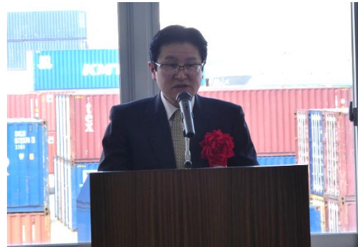
平岡酒田港国際ターミナル事業協同組合理事長