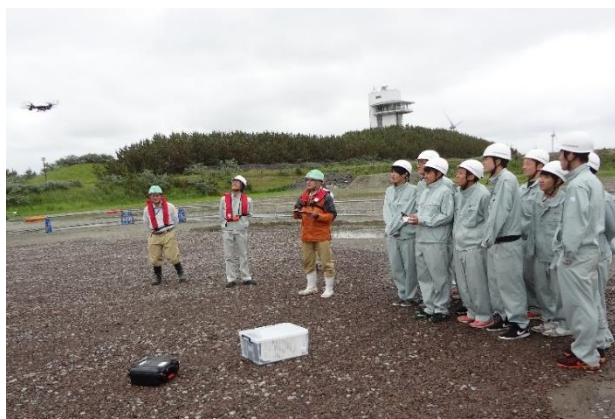
小型ドローンの操作を体験