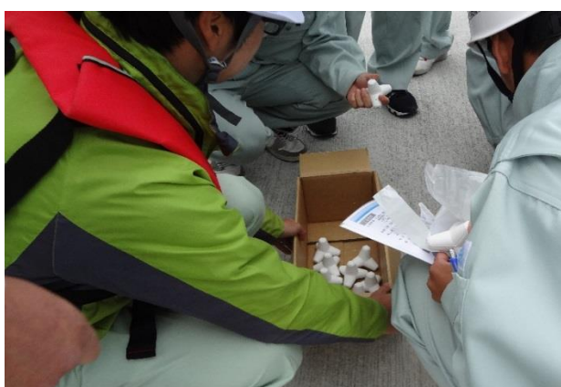
自分達で作った波消しブロック模型を持ち帰り