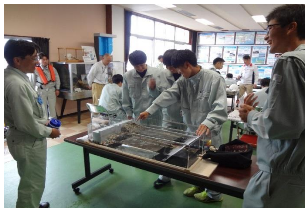
波をおこす模型で波消しブロックの効果を体験