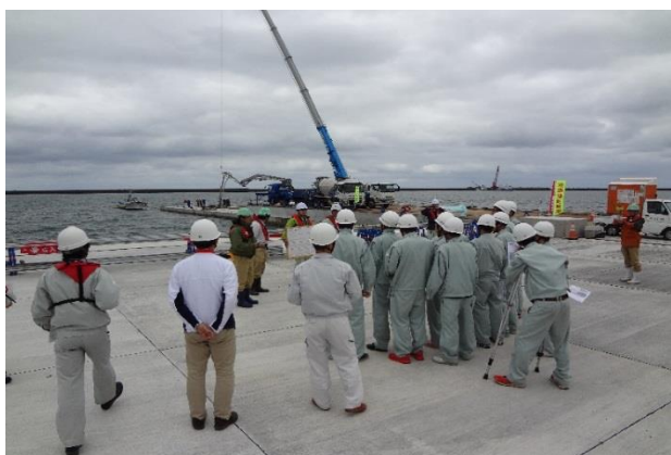
高砂岸壁の延伸工事を見学