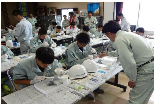
石こうを使って波消しブロック模型を製作体験

生徒の皆さんは普段見ることが出来ない港湾工事に興味を持たれ、そのスケールの大きさに驚かれていました。