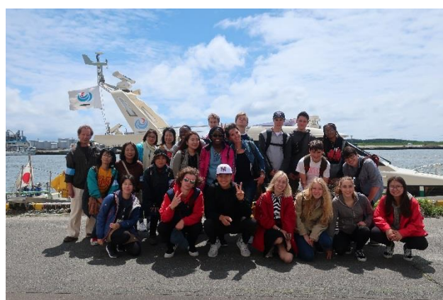
乗船前に皆で記念撮影