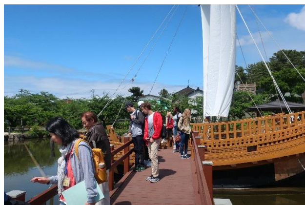
日和山公園では北前船文化に触れました

当事務所では「みなと見学会」を実施しています。 ご興味のある方はこちらの リンク をご覧ください。