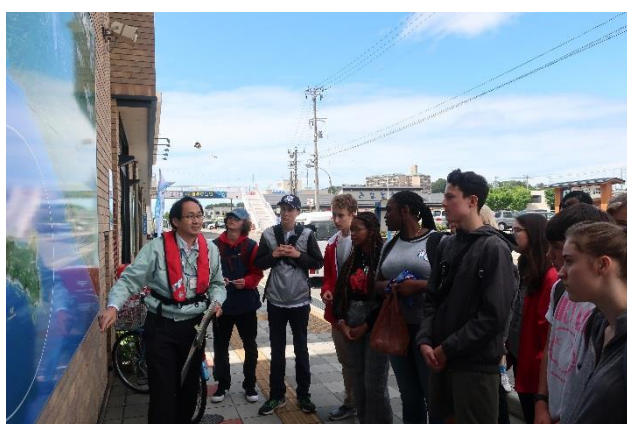
酒田海洋センターで酒田港の説明

コロラド州は海に面していない州なので生まれて初めて乗船を経験する方も多く、港内と港外での波の違いに驚かれ防波堤の役割に興味を持たれていました。