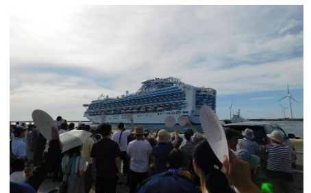
多くの市民が手を振りお見送り