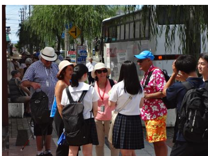
市内では高校生・大学生が観光と 飲食のガイド役として笑顔で奮闘