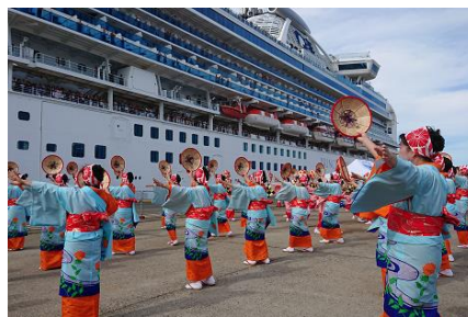
花笠保存会（山形市）と 一緒に一般来場者も踊った