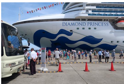
次々にバスに乗り込む観光客