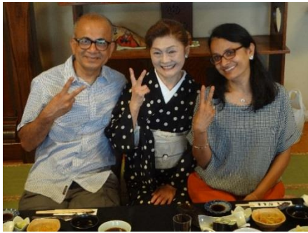
市内の飲食店には多くの外国人が訪れ 食事と交流を楽しんだ