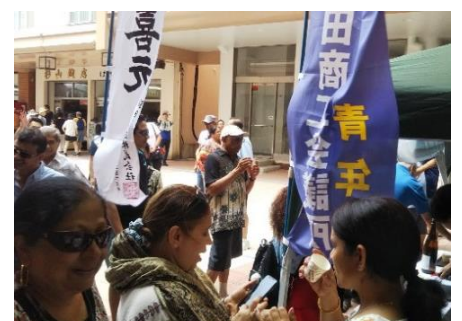
クルーズマーケットで振る舞い酒を 楽しむ外国人観光客