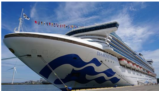
酒田港に初寄港したダイヤモンド・プリンセス

この日、古湊岸壁には多くの市民が訪れ、おもてなしを行うとともに乗船客や乗組員との交流を楽しみました。また、市内の商店街には多くの外国人観光客が訪れ、学生ボランティアが英語でのガイドに挑戦し、大活躍していました。