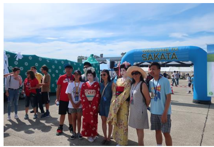
下船した乗客を酒田舞娘が歓迎