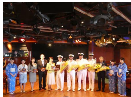
【船内セレモニー】 船長・クルーらと集合写真