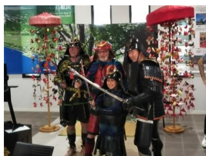
中町での甲冑着付け体験