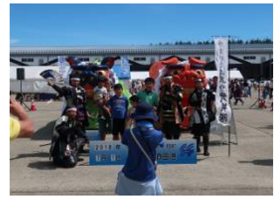
やまがた愛の武将隊と記念撮影