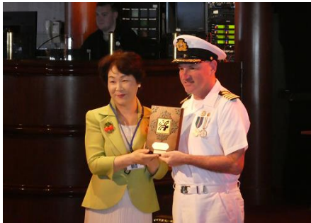
【船内セレモニー】 吉村美栄子山形県知事