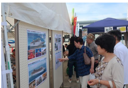
当事務所もクルーズ船に関する パネルブースを設置