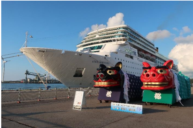
寄港した「コスタ ネオロマンチカ」と酒田市のシンボル「大獅子」

当日は多くの乗客が下船し、酒田市内観光や最上川船下りに加えて、古湊岸壁や市内の商店街でのおもてなしを楽しまれました。出港の際は花火の打ち上げもあり、市民の皆さんが盛大にお見送りしました。