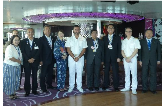
船内で行われた歓迎セレモニー