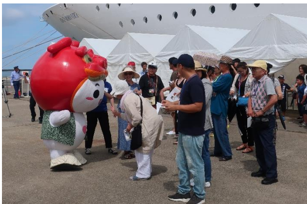
元気いっぱいの酒田市マスコットキャラ「あののん」