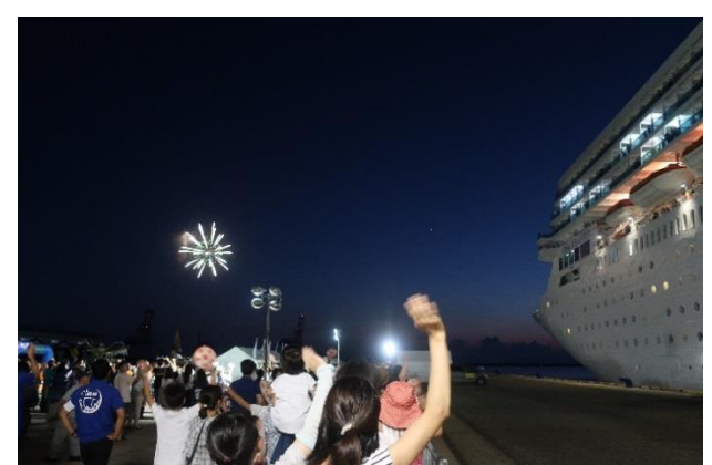
花火とともに出港する「コスタ ネオロマンチカ」