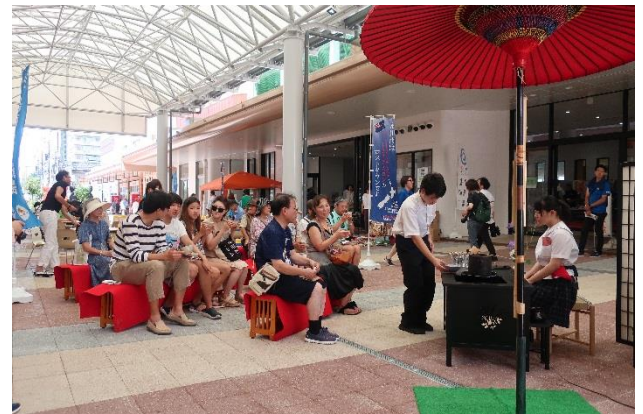
市内の商店街で高校生によるお茶を楽しむクルーズ客