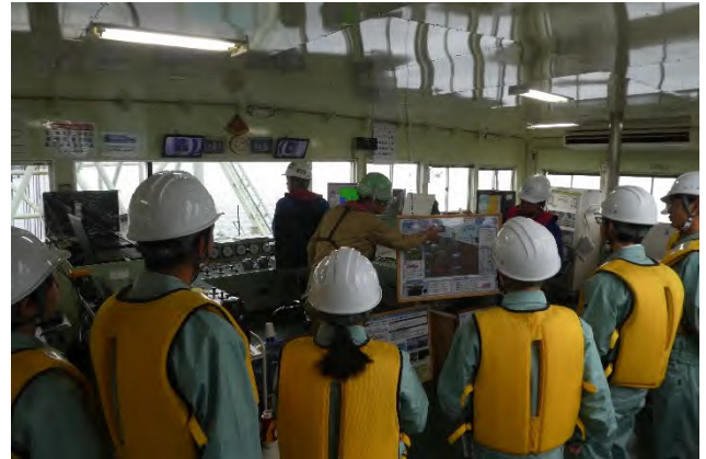
ポンプ浚渫船運転室にて浚渫船について説明