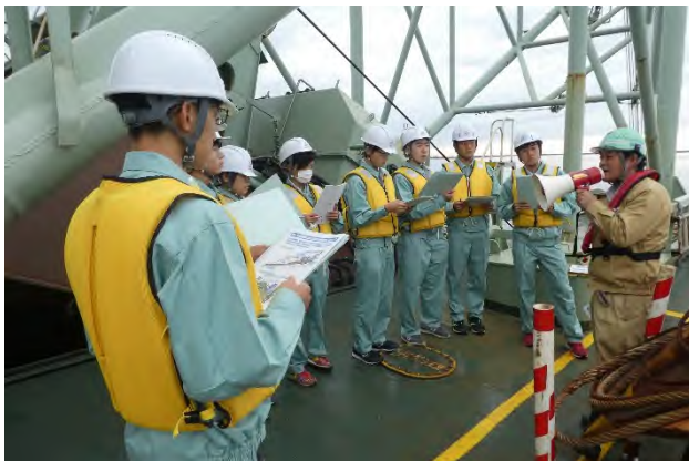
ポンプ浚渫船甲板にて浚渫作業について説明