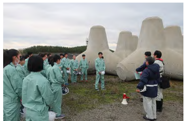
波消しブロック実物を前に、お礼のご挨拶を頂戴しました