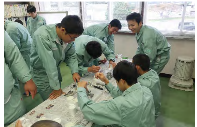
波消しブロック模型製作体験の様子