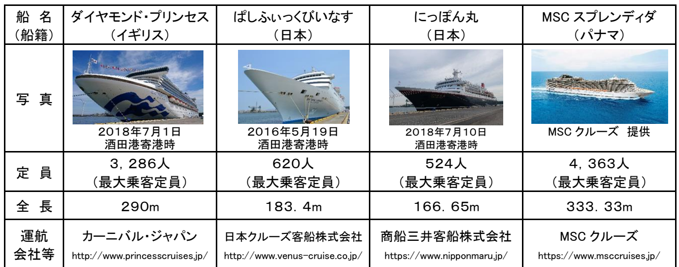
酒田港へ寄港するクルーズ船の寄港回数の推移