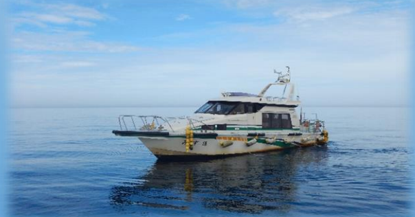
港湾業務艇「みずほ」

国交省業務艇「みずほ」で酒田港内を見学し、陸上では波消しブロックをご覧いただきます。