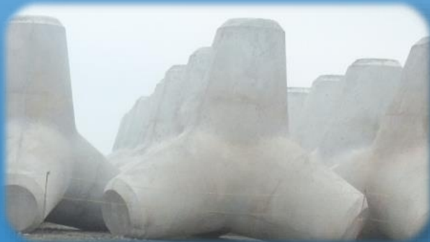
波消しブロック見学