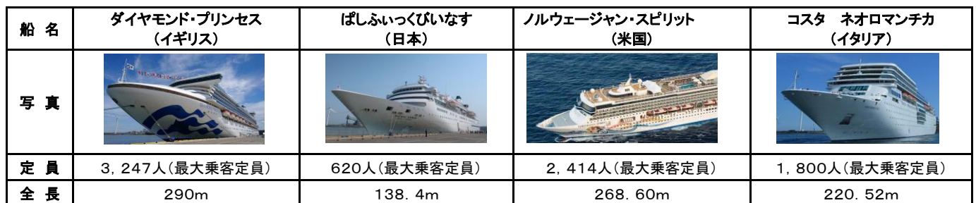
●酒田港におけるクルーズ船寄港回数