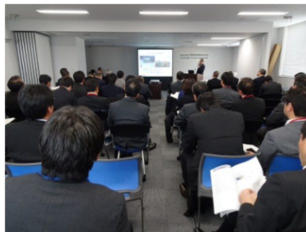
民間技術発表会開催状況