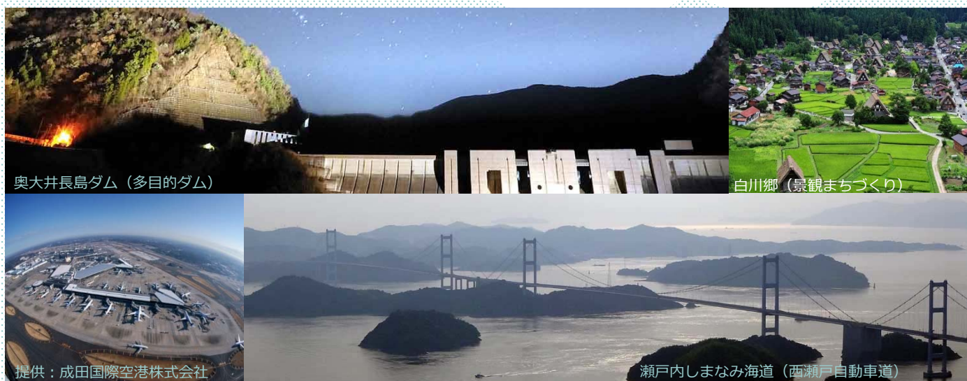
奥大井長島ダム (多目的ダム)