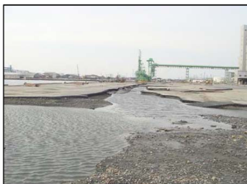
日和6号埠頭の被災状況