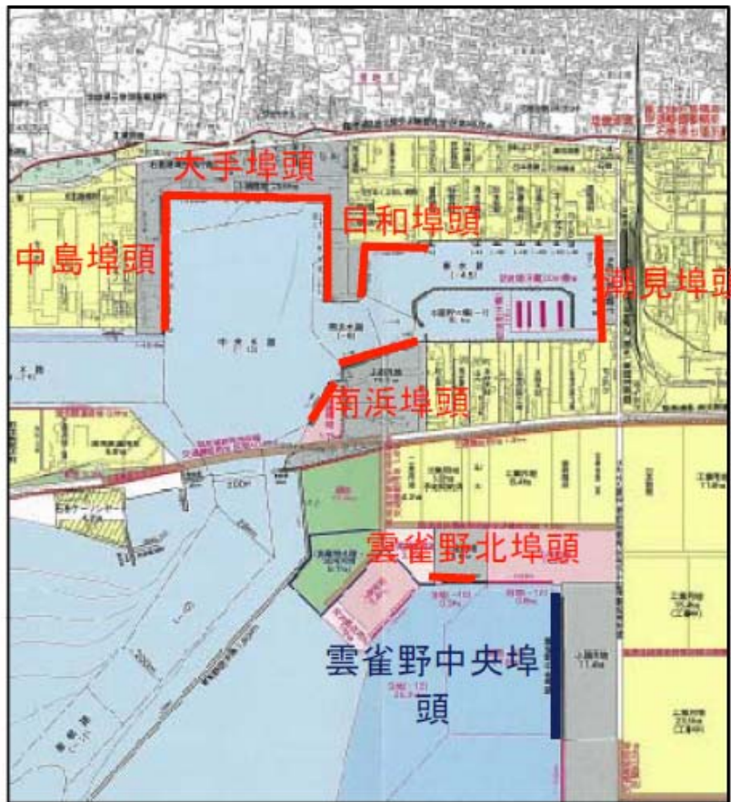
石巻港 災害復旧対象施設位置図(県施工分)