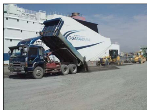
日和6号埠頭の応急復旧工事の様子