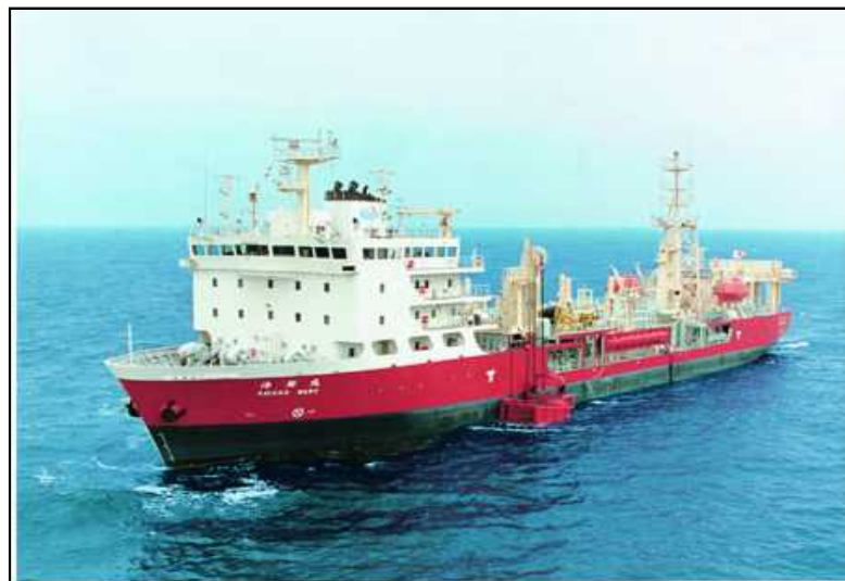
「海翔丸」による緊急支援物資の輸送