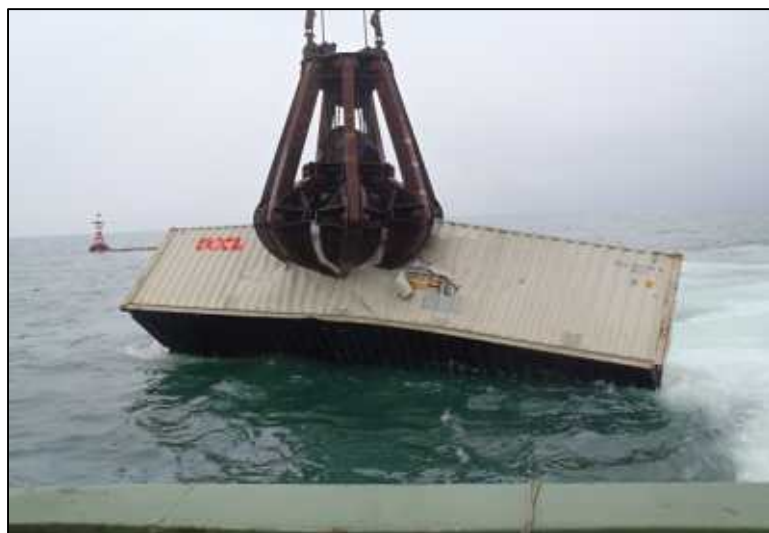
航路啓開(コンテナの引き上げ)