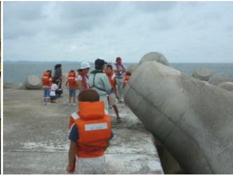
沖防波堤上陸にて防波堤の役割を体験