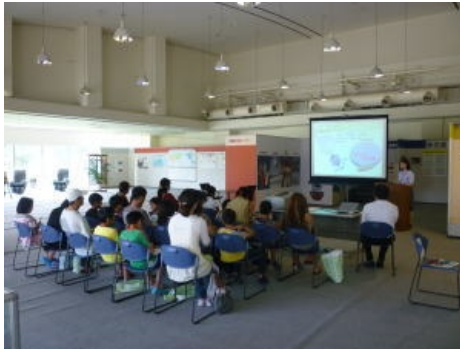
アクセルでの貿易の勉強会