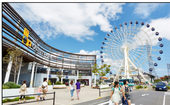
三井アウトレットパーク 仙台港