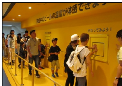
ビール工場見学ツアー