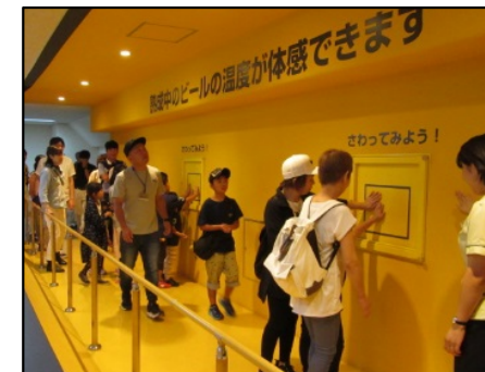
ビール工場見学ツアー