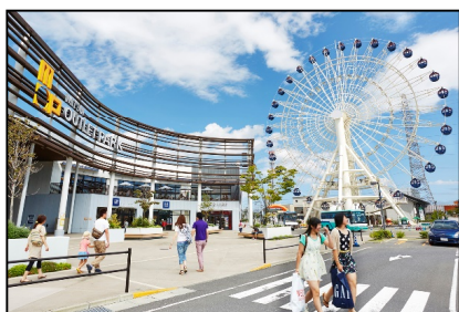
三井アウトレットパーク仙台港