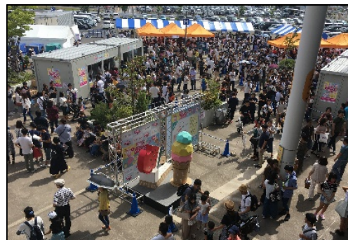
アイスクリーム万博“あいぱく”