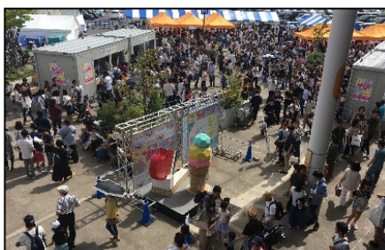
アイスクリーム万博“あいぱく”