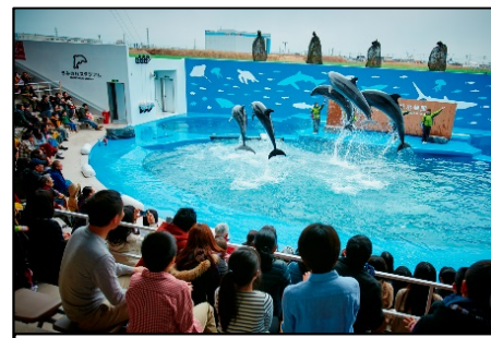
イルカ・アシカのパフォーマンス (仙台うみの杜水族館)