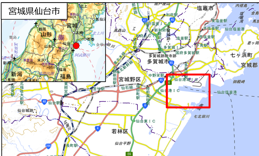
国土地理院地図（電子国土Web）( http://maps.gsi.go.jp )をもとに国土交通省作成