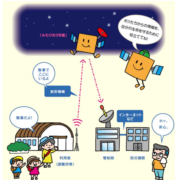
衛星安否確認サービス (略称 : Q-ANPI)