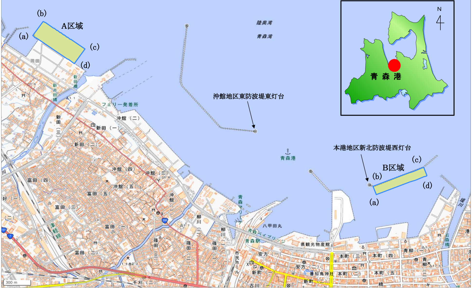
※国土地理院地図「GSI Maps」 ( https://maps.gsi.go.jp/ ) をもとに青森港湾事務所作成