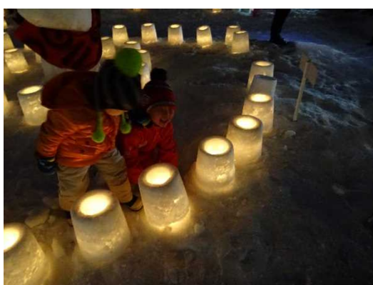
▲子どもたちとキャンドル