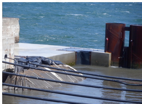
↑ 完成した間詰コンクリート ↑