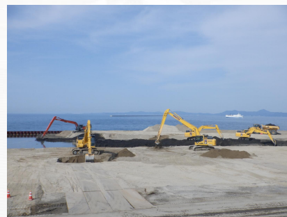
↑ 裏埋土埋戻しの様子 ↑