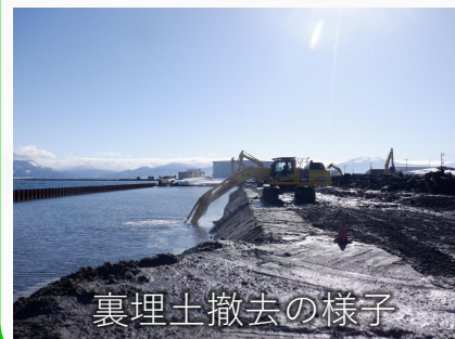
裏埋土撤去の様子