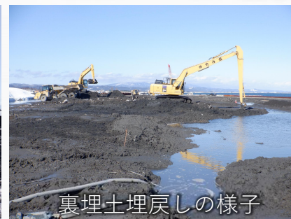
裏埋土埋戻しの様子