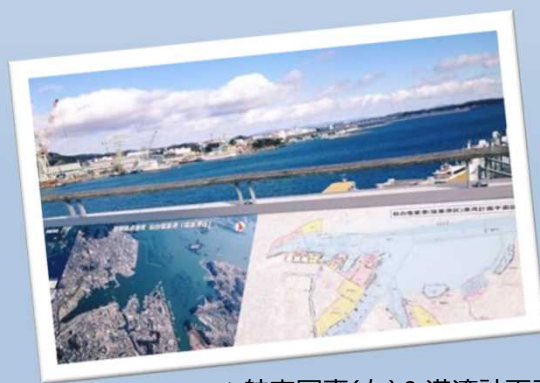
▲航空写真(左)&港湾計画平面図(右)

また、マリンゲート塩釜は、イベント会場としても使われており、地元や近隣の方々も多く訪れています。