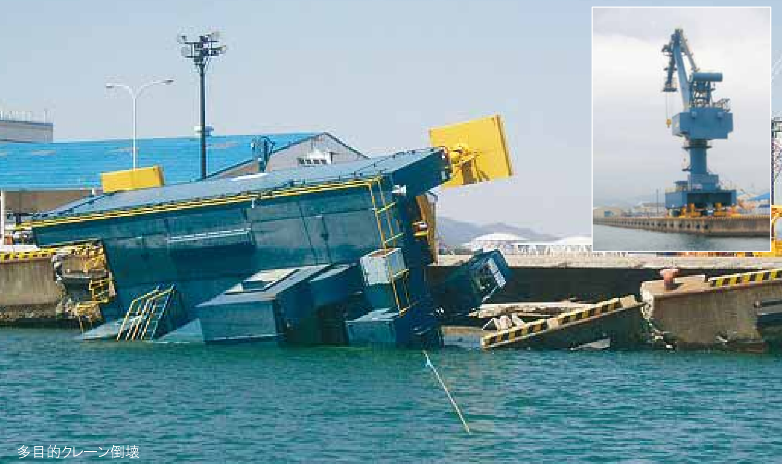
多目的クレーン倒壊