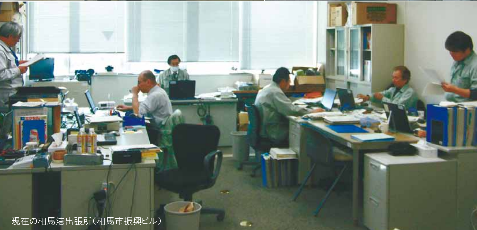
現在の相馬港出張所(相馬市振興ビル)