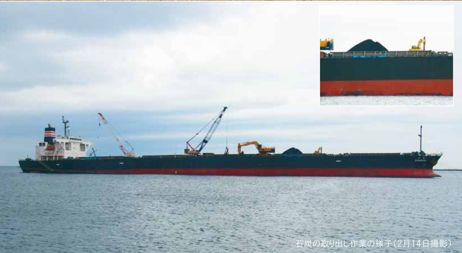
石炭の取り出し作業の様子(2月14日撮影)