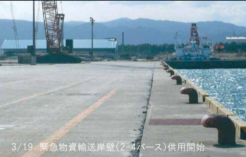
3/19 緊急物資輸送岸壁(2-4バース)供用開始