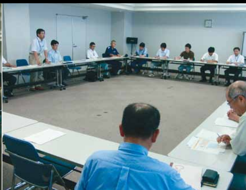
▲8/18「第3回復興会議相馬港復旧・復興方針」策定・公表