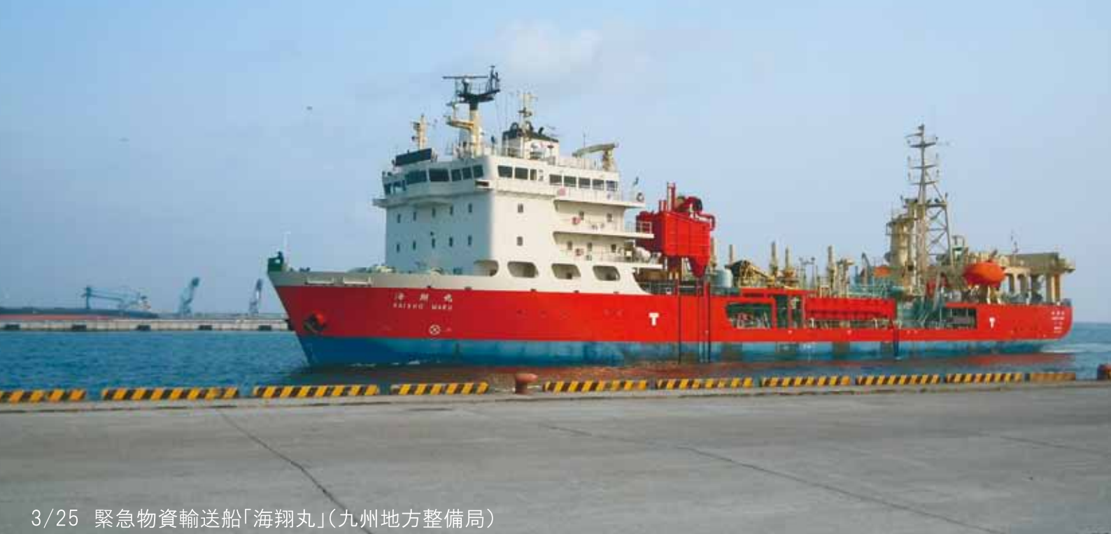
3/25 緊急物資輸送船「海翔丸」(九州地方整備局)