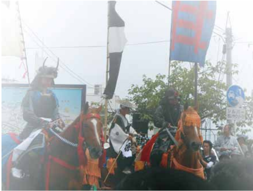
「相馬野馬追」平成23年7月23日撮影