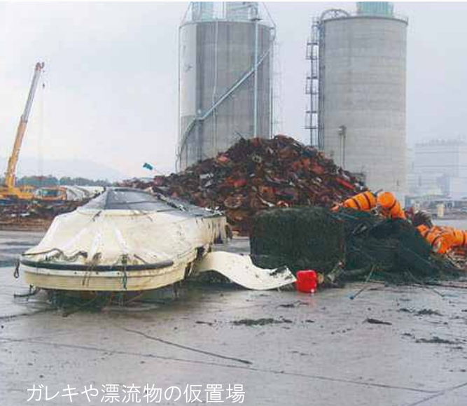
ガレキや漂流物の仮置場