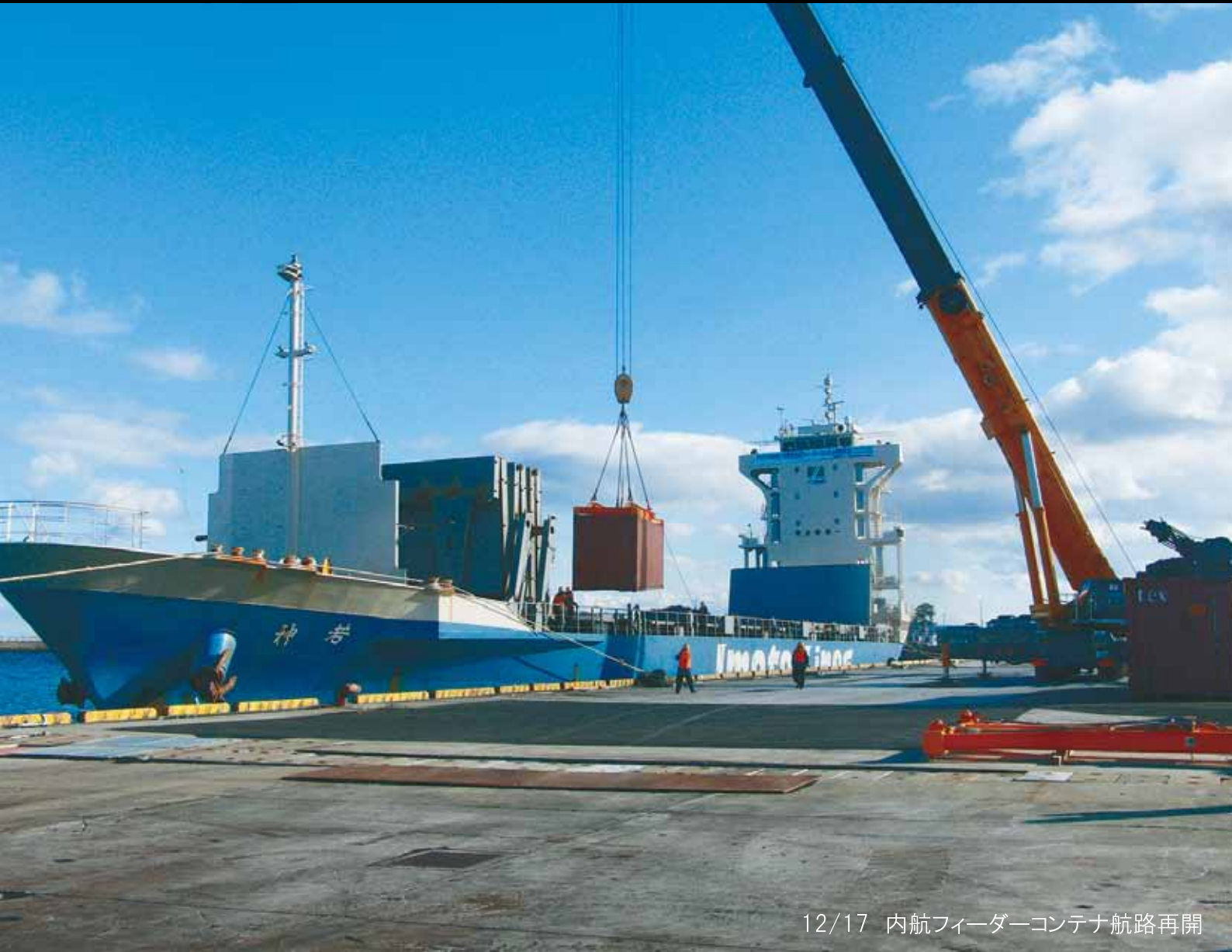
12/17 内航フィーダーコンテナ航路再開