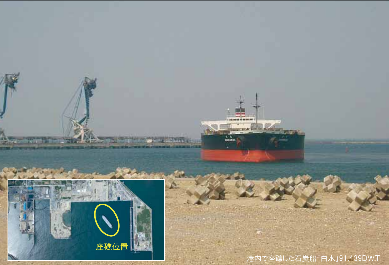
港内で座礁した石炭船「白水」91,439DWT