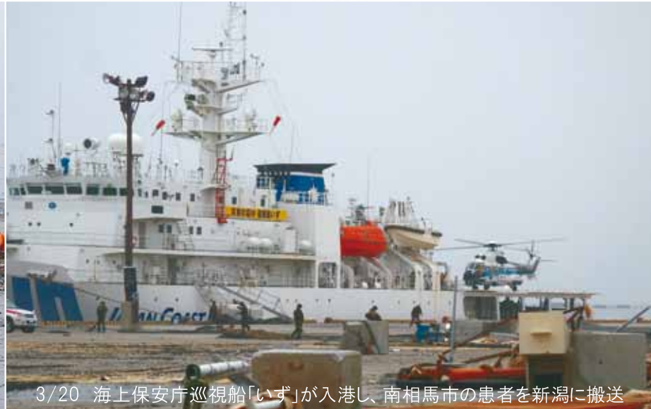
3/20 海上保安庁巡視船「いず」が入港し、南相馬市の患者を新潟に搬送