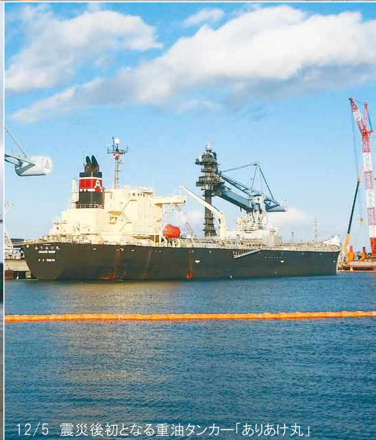
12/5 震災後初となる重油タンカー「ありあけ丸」