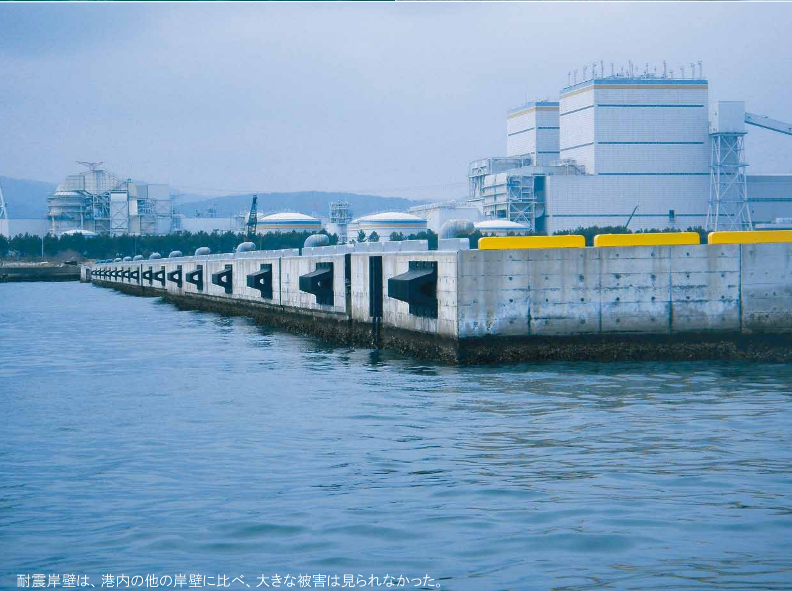
耐震岸壁は、港内の他の岸壁に比べ、大きな被害は見られなかった。