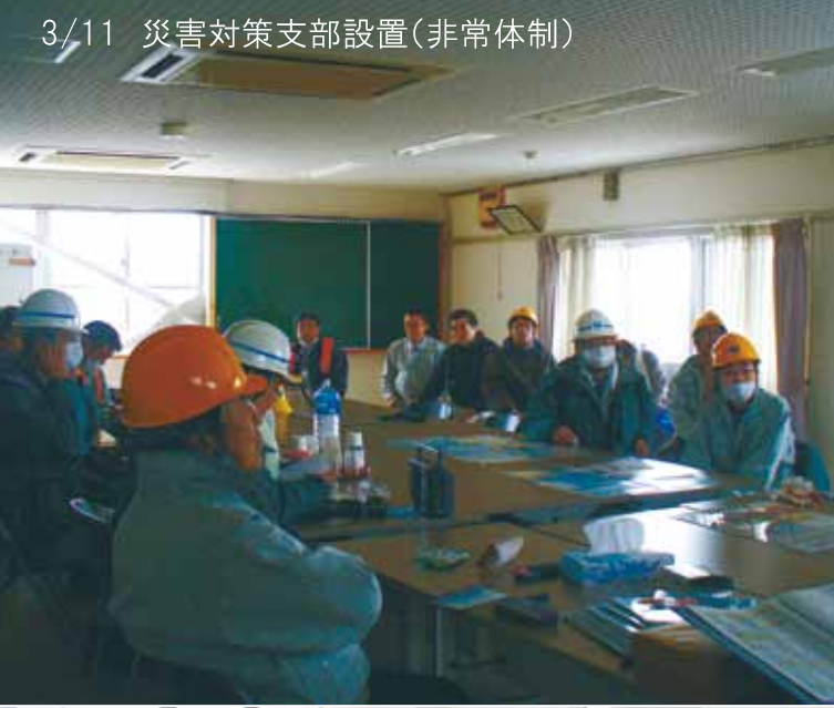
3/11 災害対策支部設置(非常体制)