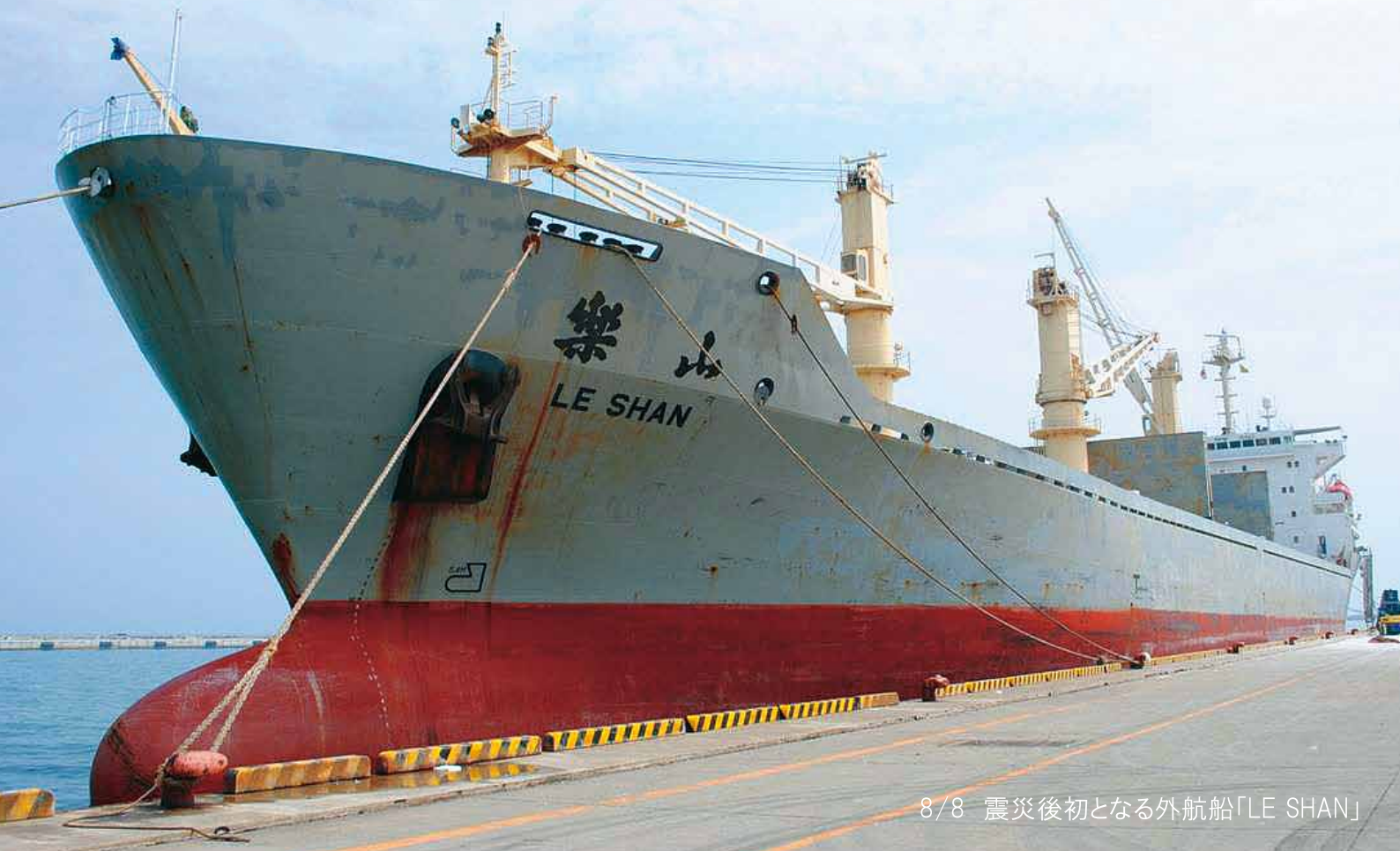
8/8 震災後初となる外航船「LE SHAN」