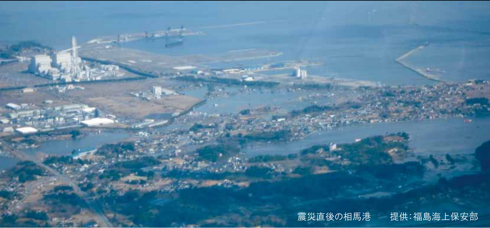
震災直後の相馬港