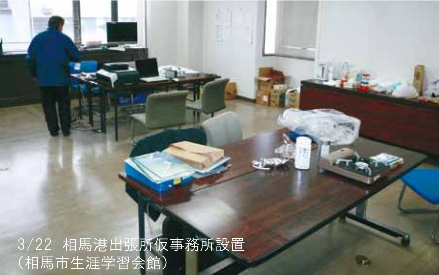
3/22 相馬港出張所仮事務所設置 (相馬市生涯学習会館)