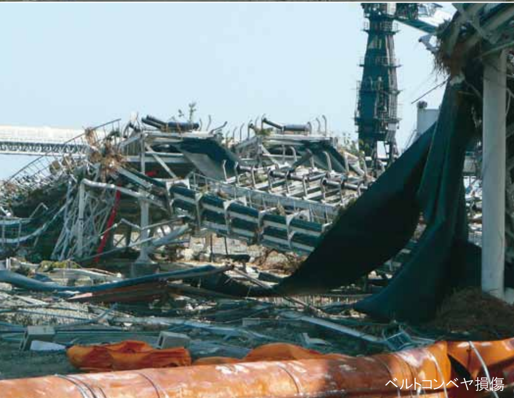
ベルトコンベヤ損傷