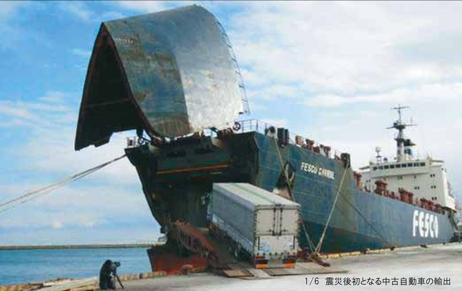
1/6 震災後初となる中古自動車の輸出