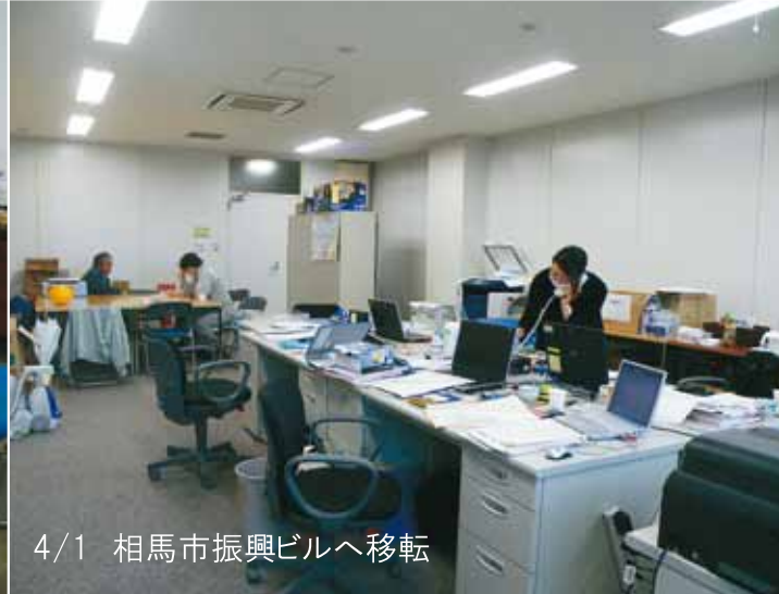
4/1 相馬市振興ビルへ移転