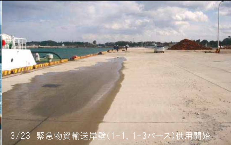
3/23 緊急物資輸送岸壁(1-1、1-3バース)供用開始