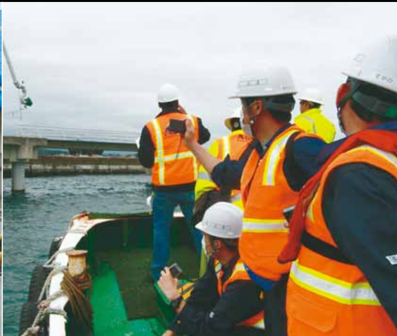
H23. 6. 18 大畠前国土交通大臣