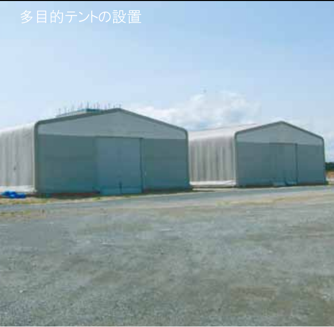
多目的テントの設置