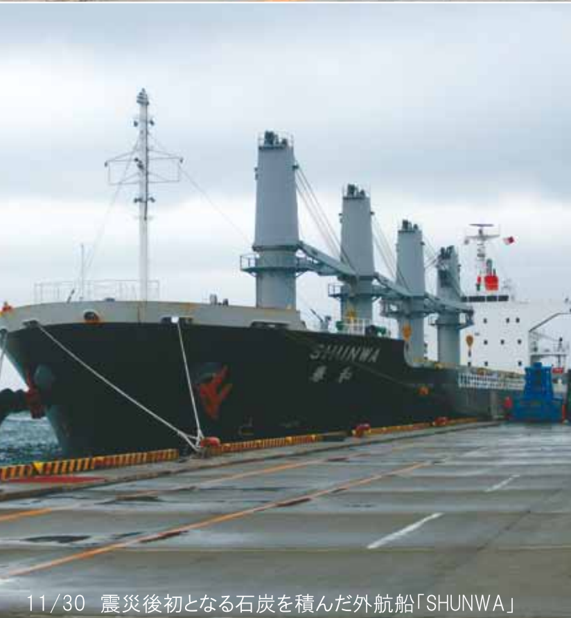
11/30 震災後初となる石炭を積んだ外航船「SHUNWA」