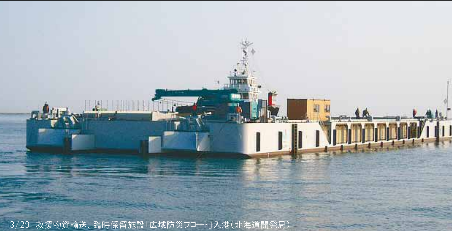
3/29 救援物資輸送、臨時係留施設「広域防災フロート」入港(北海道開発局)