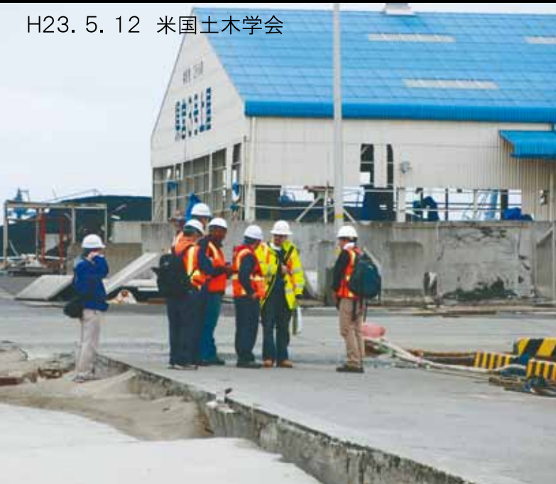
H23. 5. 12 米国土木学会