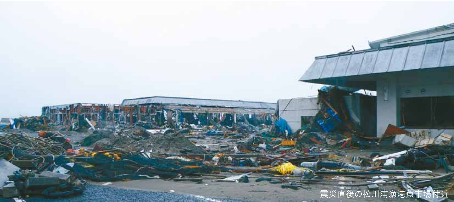
震災直後の松川浦漁港魚市場付近