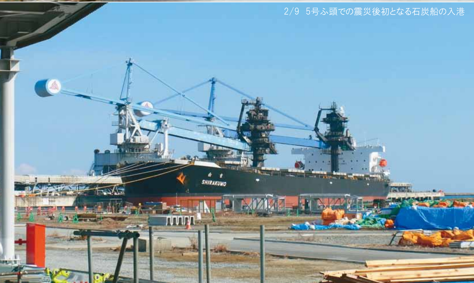
2/9 5号ふ頭での震災後初となる石炭船の入港