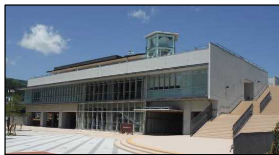
おおふなぽーと (大船渡市防災観光交流センター)