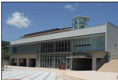
【代表施設】おおふなぽーと