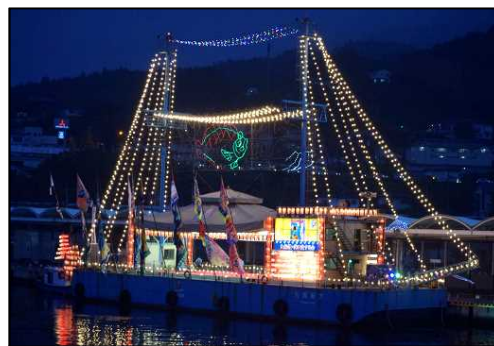
三陸・大船渡夏祭り