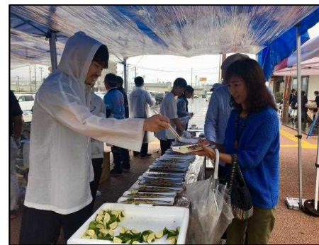
新生おおふなとさんま祭