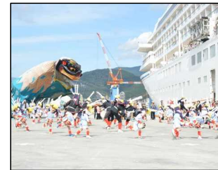
クルーズ客船歓迎行事