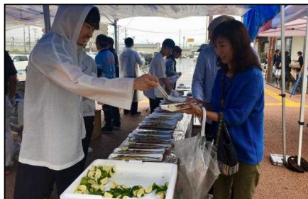
新生おおふなとさんま祭