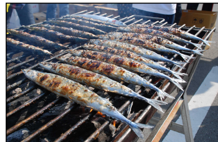
おおふなと名物さんま