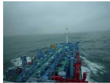
▲航走及び放水拡散状況(近影)