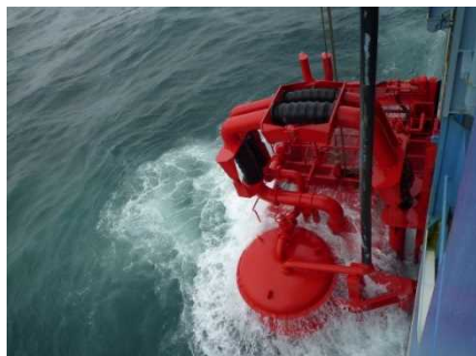
▲油回収機の稼働状況(近影)