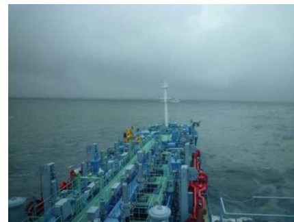
▲油回収作業状況(近影)