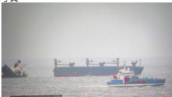
▲航走及び放水拡散作業状況