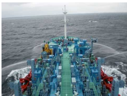
▲航走及び放水拡散状況（近影）