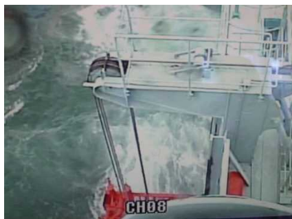
▲油回収機の稼働状況(近影)