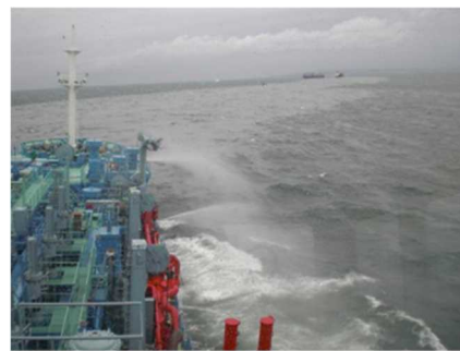
▲航走及び放水拡散状況（近影）