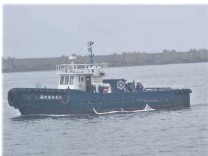
▲埋浚作業船 油吸着材吹き流し型による防除作業状況