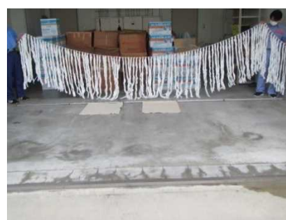
▲油吸着材 上：吹き流し型 下：マット型