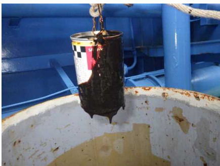
▲「白山」油水槽に回収した流出油