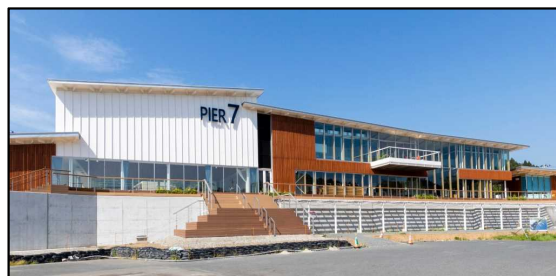
気仙沼市まち・ひと・しごと交流プラザ「ウマレル」(PIER7)