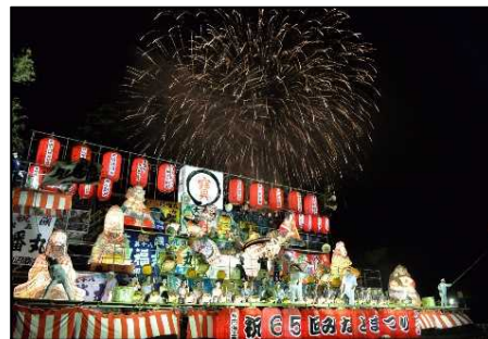
気仙沼みなとまつり