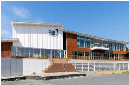
【代表施設】気仙沼市まち・ひと・しごと 交流プラザ『ウマレル』(PIER7)