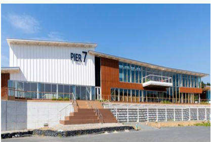
構成施設のイメージ 【代表施設の例】