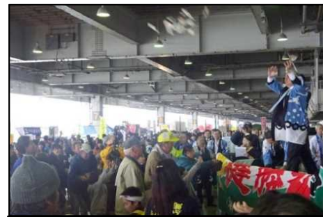
気仙沼市産業まつり・市場で朝めし。