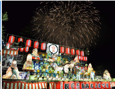
気仙沼みなとまつり