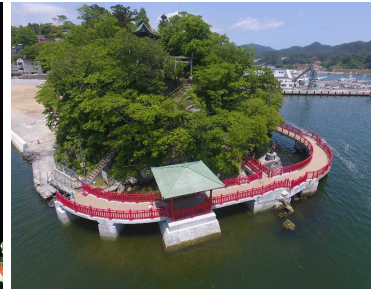
海上遊歩道と恵比寿像