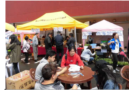
気仙沼みなとでマルシェ。