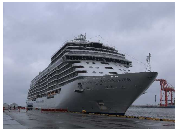
▲5/7 セブンシーズ・エクスプローラー（仙台塩釜港）