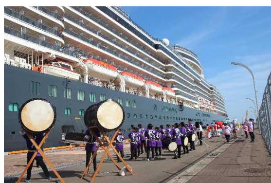
▲5/26 クイーン・エリザベス歓迎催事（青森港）