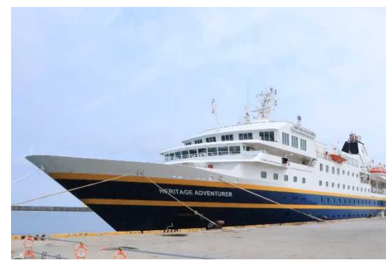
▲5/27 ヘリテージ・アドベンチャー（能代港）