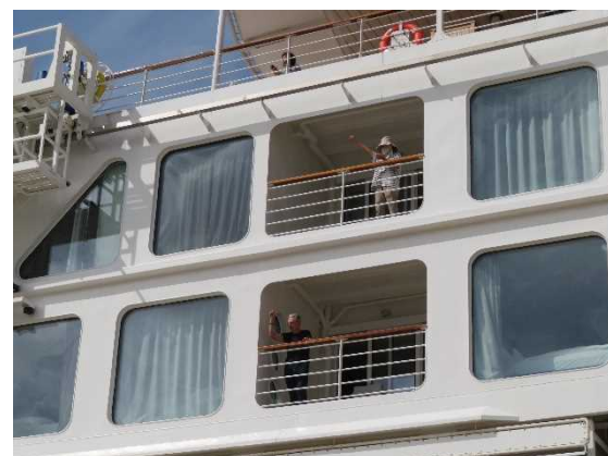
▲5/23 ハンセアティック・ネイチャー（秋田港）