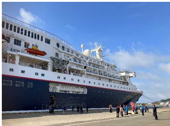
▲5/3 にっぽん丸歓迎催事（船川港）