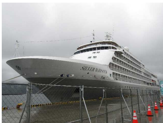
▲5/7 シルバー・ウィスパー（宮古港）