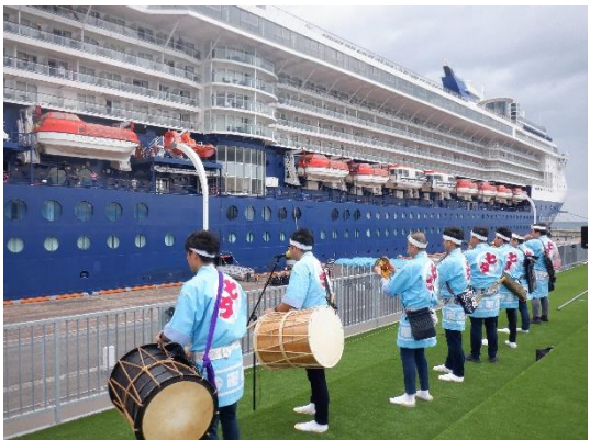
▲7/24 セブリティ・ミレニアム歓迎イベント（青森港）