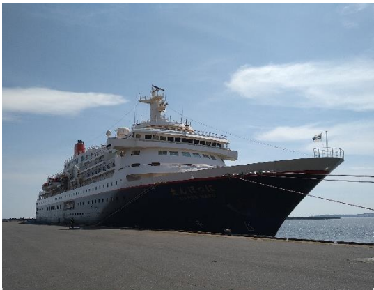
▲7/21 にっぽん丸（八戸港）