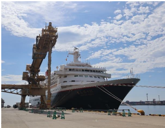
▲7/23 にっぽん丸（仙台塩釜港（仙台港区））