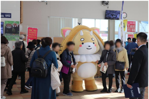
▲11/6 MSC ベリッシマ寄港時の様子 （秋田港）