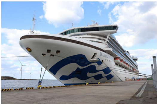
▲11/14 ダイヤモンド・プリンセス寄港時の様子 （秋田港）