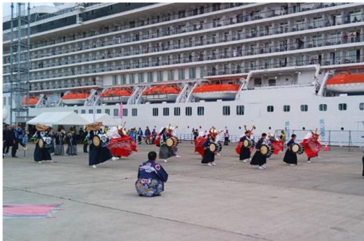
▲11/2 シーボーン・クエスト寄港時の様子 （秋田港）