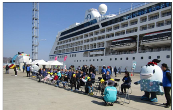
▲3/25 レガッタ寄港時の様子 (宮古港)