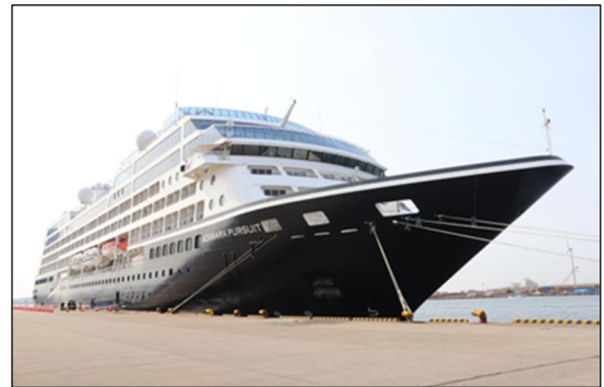
▲3/23 アザマラ・パシュート寄港時の様子 (秋田港)