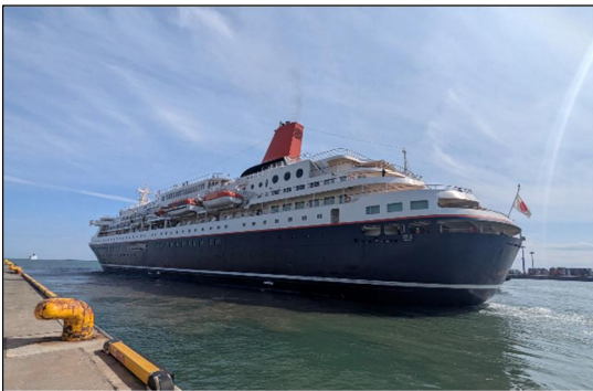
▲3/20 にっぽん丸寄港時の様子 (仙台塩釜港)