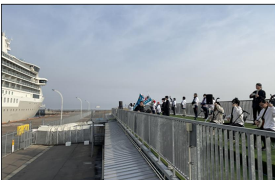
▲3/23 シルバー・ノヴァ寄港時の様子 (青森港)