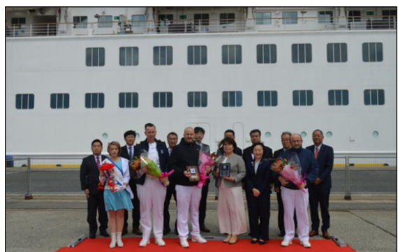
▲5/5 クリスタル・シンフォニー寄港時の様子 (酒田港)