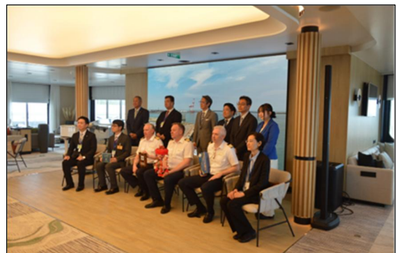
▲5/28 ミネルバ寄港時の様子 (酒田港)