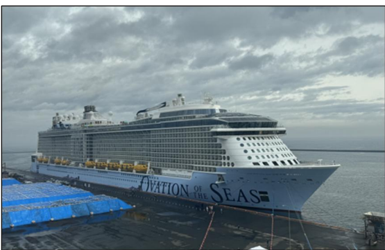
▲5/4 オベーション・オブ・ザ・シーズ寄港時の様子 (青森港)