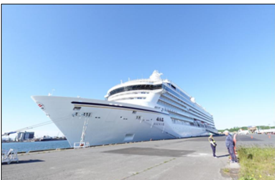
▲5/31 飛鳥Ⅲ寄港時の様子 (八戸港)