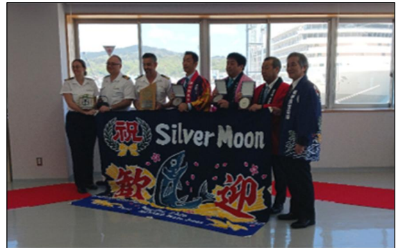
▲5/2 シルバー・ムーン寄港時の様子 (宮古港)