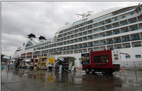
▲5/1 ミツイオーシャンフジ寄港時の様子 (宮古港)