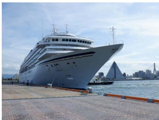
▲青森港に入港した「飛鳥Ⅱ」