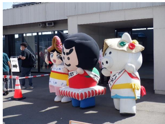
▲ゆるキャラ（左からセイラ、ねぶたん、ハネトン）