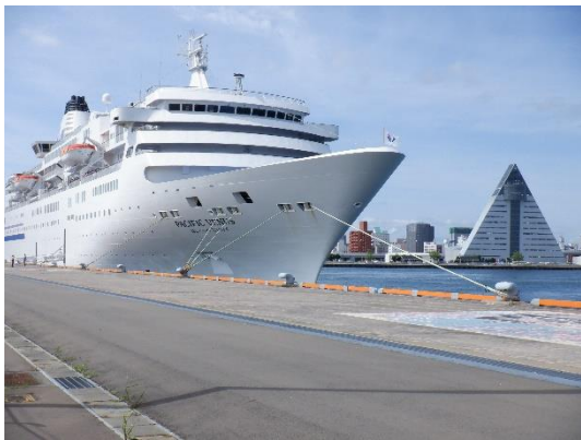
▲青森港に入港した「ぱしふいっくびいなす」