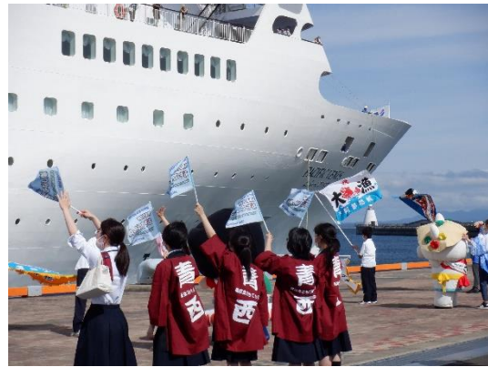
▲寄港を歓迎する地元の高校生