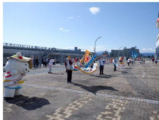
▲大漁旗を振り歓迎する地元の方々