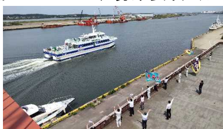
いってらっしゃーい