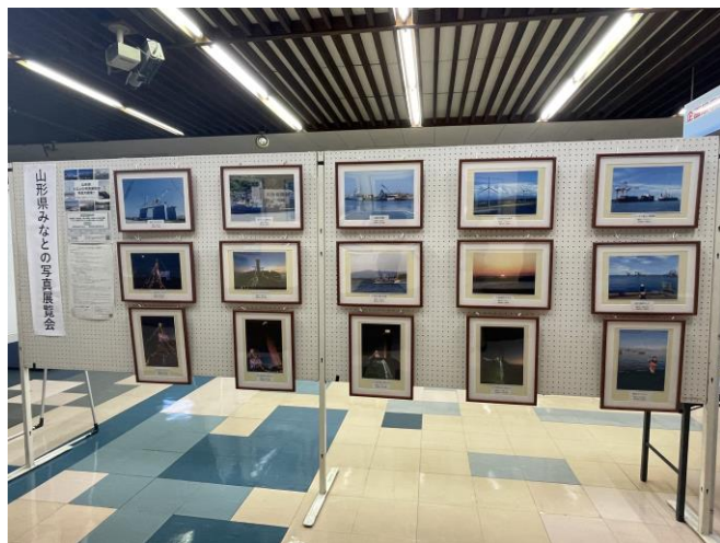
展覧会の開催状況