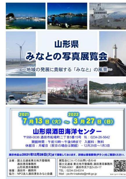
写真展覧会開催のチラシ