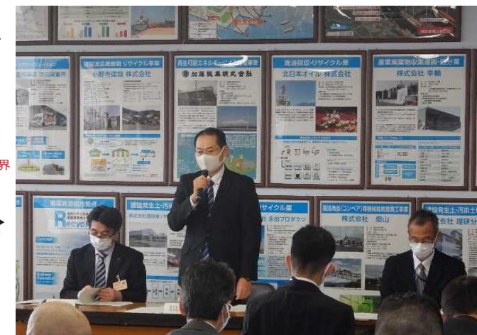
協議会会長(酒田港湾事務所長)の挨拶