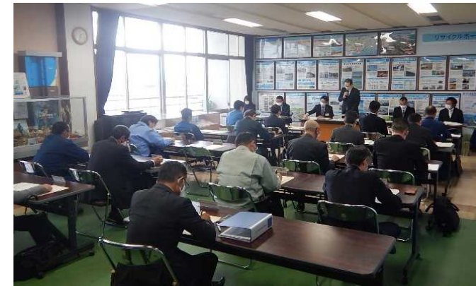
協議会開催の様子