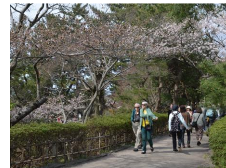
日和山公園を散策する乗客