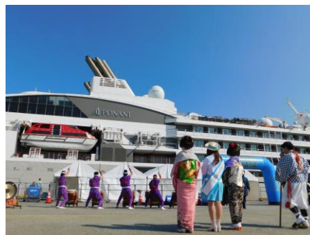
歓迎イベントの様子