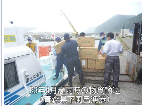
R3年8月豪雨時の物資輸送 (青森県下風呂漁港)