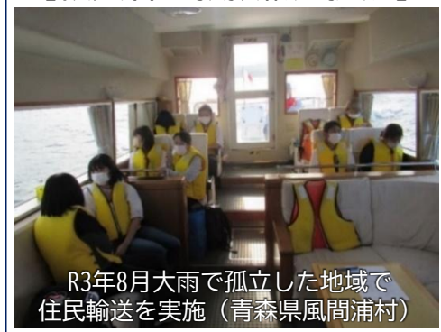
R3年8月大雨で孤立した地域で 住民輸送を実施 (青森県風間浦村)