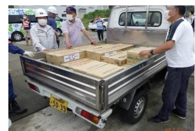
R5年7月に江名港(福島県いわき市)で実施した、緊急物資輸送・被災者輸送訓練