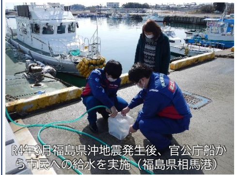
R4年3月福島県沖地震発生後、官公庁船から 市民への給水を実施 (福島県相馬港)