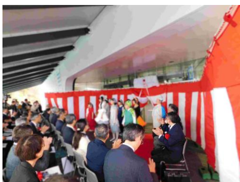
オープニングアクト