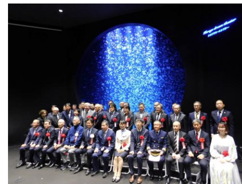
記念セレモニーの様子