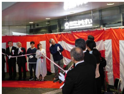
正面サインの除幕式