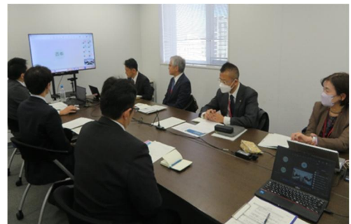
カンファレンスの様子